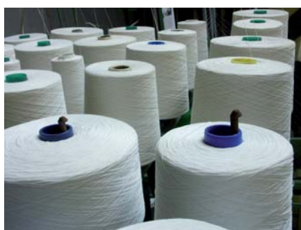
In der Textilindustrie sind Mitsubishi-Frequenzumrichter auch nicht mehr wegzudenken.