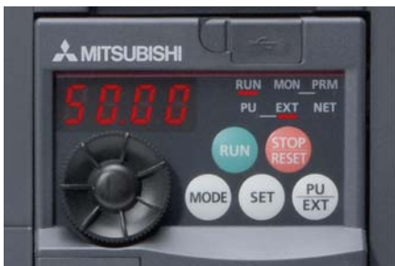
Das eingebaute Multi-User-Panel mit „Digital-Dial“

Neben der Eingabe und Anzeige verschiedener Parameter erfolgt die Überwachung und Ausgabe aktueller Betriebsgrößen und Alarmmeldungen auf der ebenfalls integrierten vierstelligen LED-Anzeige.