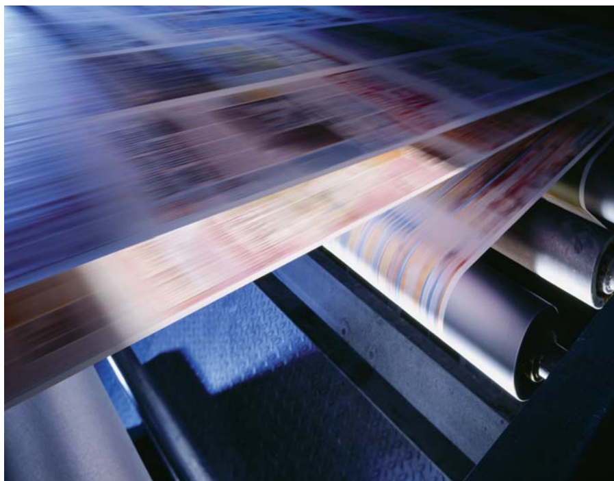
Materialtransport, wie in einem Druckverlag sind nur eine der vielfältigen Einsatzgebiete der neuen FR-E700-Serie