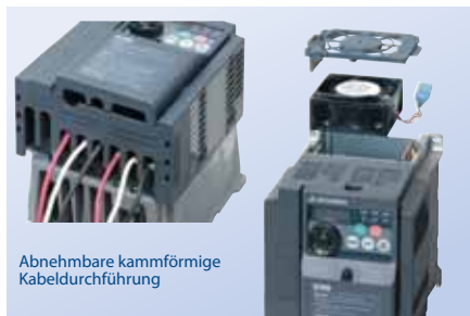
Abnehmbare kammförmige Kabeldurchführung

Die Lüfter sind als kompakte Einheiten konstruiert und im Reinigungs- und Fehlerfall in weniger als 10 Sekunden zu wechseln.