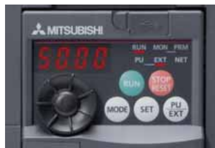
Das eingebaute Multi-User-Panel mit „Digital-Dial“

Neben der Eingabe und Anzeige verschiedener Parameter erfolgt die Überwachung und Ausgabe aktueller Betriebsgrößen und Alarmlmeldungen auf der ebenfalls integrierten vierstelligen LED-Anzeige.